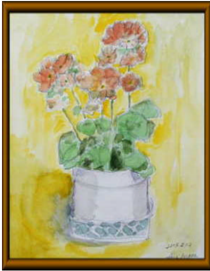
井上 光 (昭 35 法)