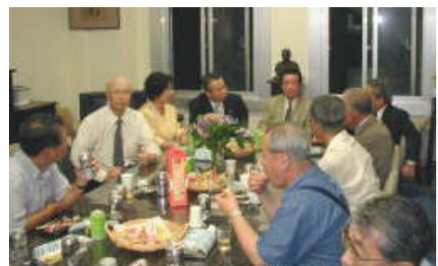
和やかな歓談風景