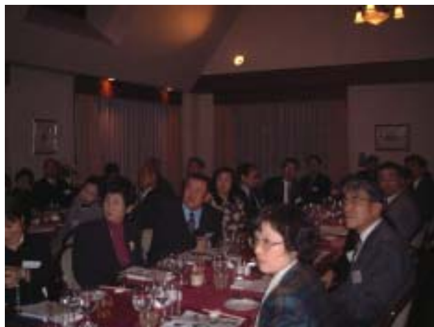
<食事を前に講演を熱心に聴き入る参加者>

5千円の会費でこんなに素晴らしいフランス料理とワインが楽しめるのかという声があがるほどでした。何しろいきなり大根ステーキのフォアグラ添えが出てきて度肝を抜かれ、お魚料理もステーキも素晴らしいものでした。