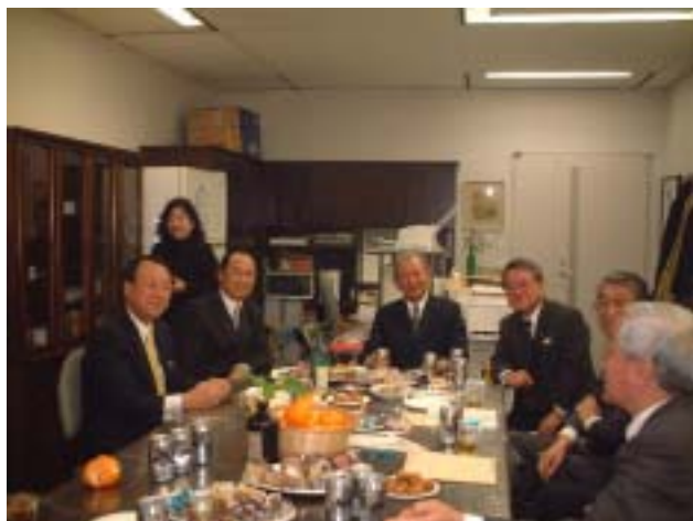
<早稲田倶楽部の皆さんとも懇親>

今年は新世紀ということもあり、初めての試みとして1月4日に倶楽部ルームにおいて新年賀詞交換会を開催致しました。